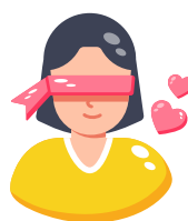
LÁSKA JE SLEPÁ