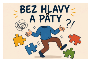
BEZ LOGIKY A BEZ ZMYSLU