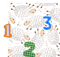
OKA SOM NEZAŽMÚRIL