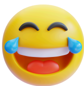
SMAŤ SA DO KRČOV