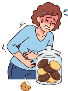
PRÍLIŠ VEĽA DOBRÉHO ŠKODÍ