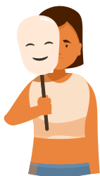
NIE JE VŠETKO ZLATO, ČO SA BLIŠTÍ